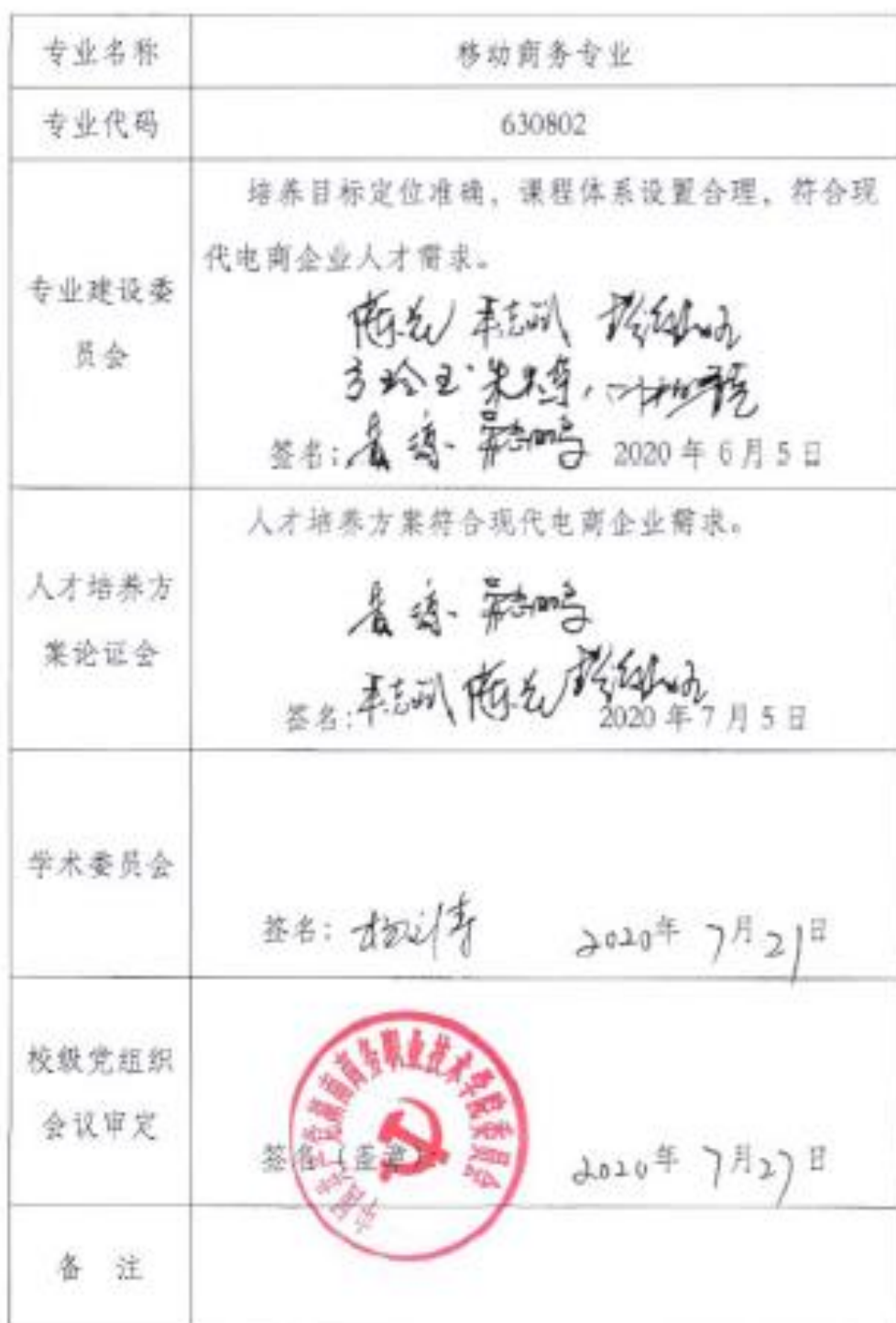
2020 级专业人才培养方案制订与审核表